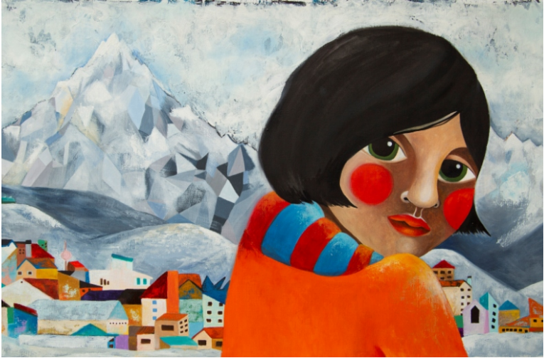
Ilustración: "Mi nombre es Ushuaia". Autora: Sol Cófreces