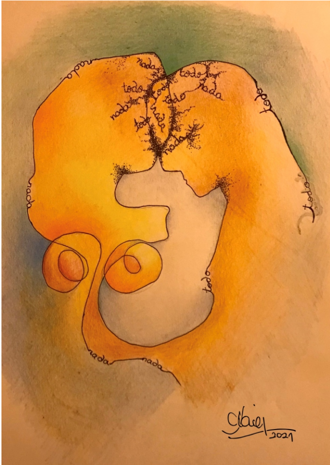
Ilustración. S/t. Autora: Alicia Figueroa