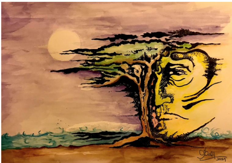
Ilustración. S/t. Autora: Alicia Figueroa