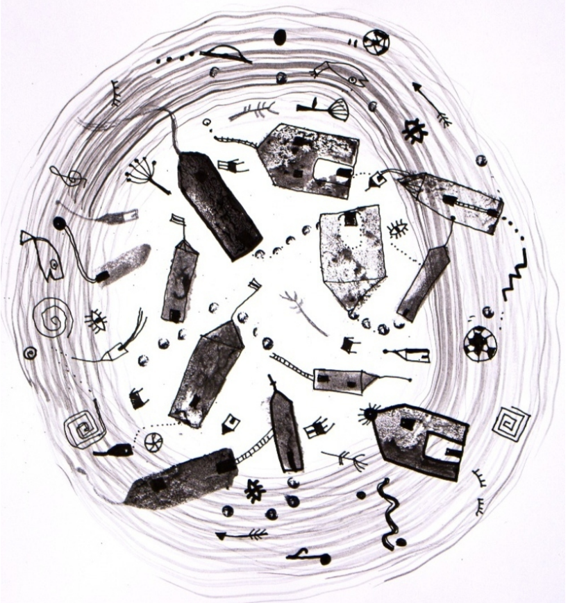
Ilustración: Ana Paula Luberti, para Sueños Enredados